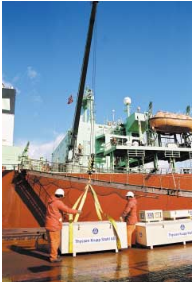
Einschiffung in Rotterdam