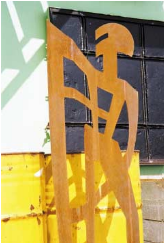
Kleiner Schildträger, 1,60 m hoch Corten-Stahl