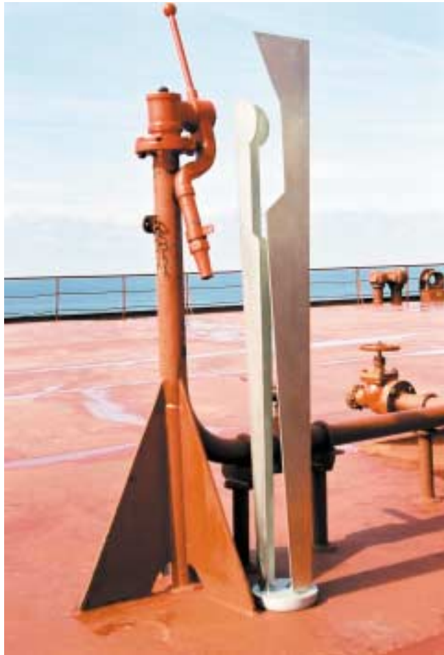
Körpersäule, 1,60 m hoch Edelstahl