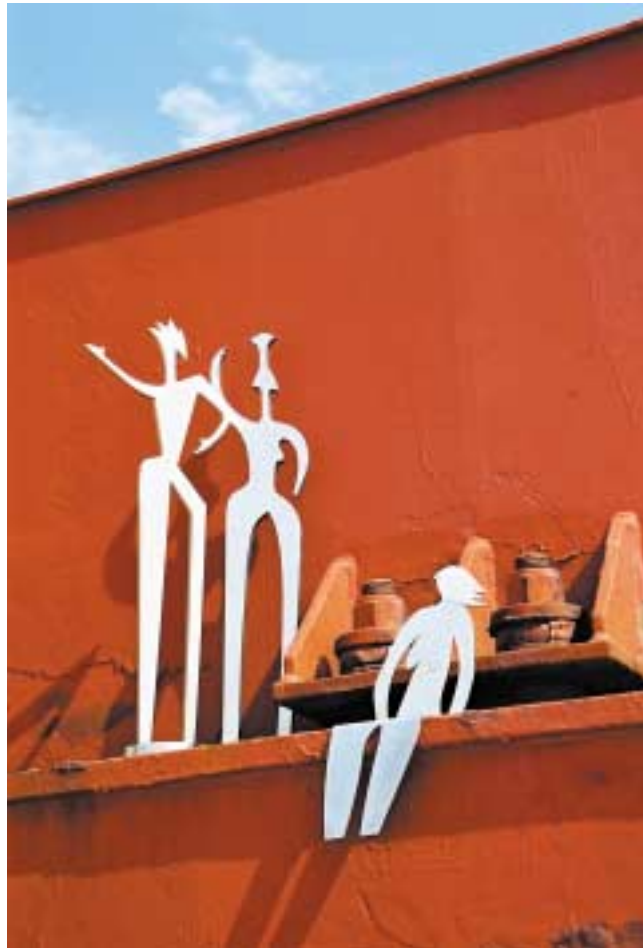
Komposition, 50/24 cm hoch Edelstahl