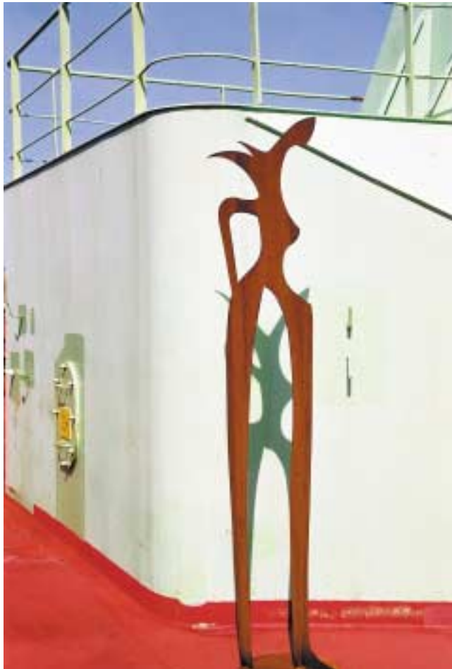
Botin, 2,50 m hoch Corten-Stahl