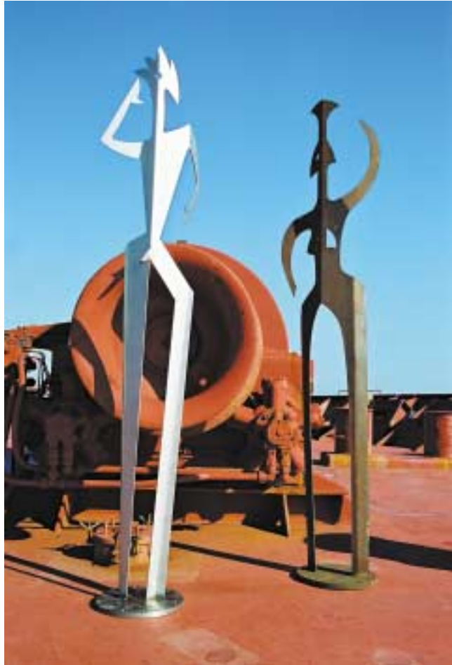
Tänzer und Tänzerin, 2,50 m hoch Edelstahl und Corten-Stahl