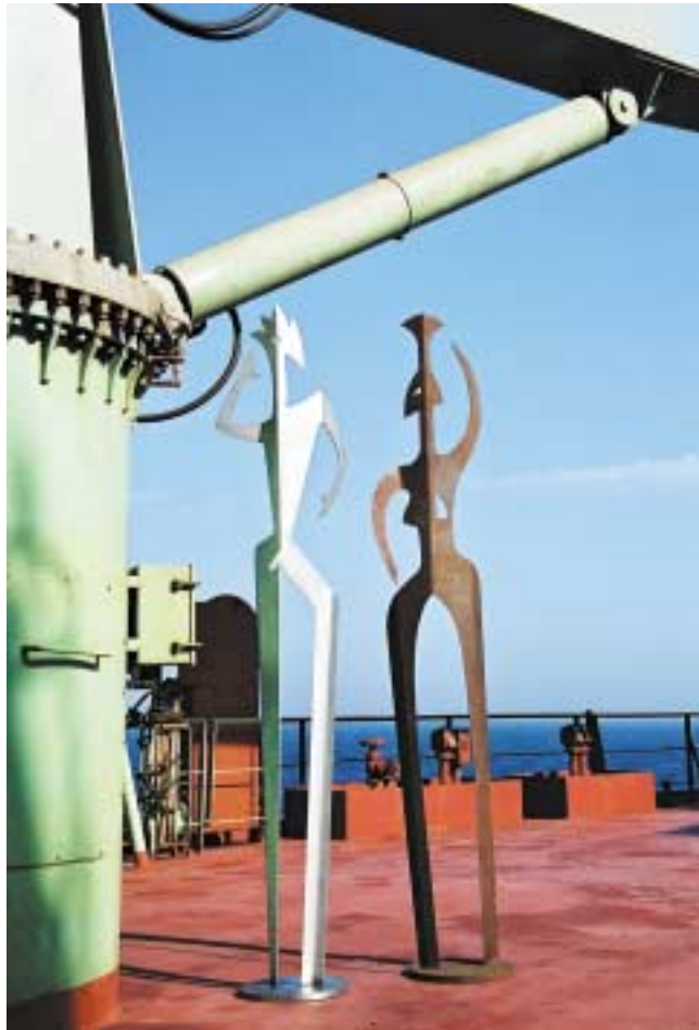
Tänzer und Tänzerin, 2,50 m hoch Edelstahl und Corten-Stahl