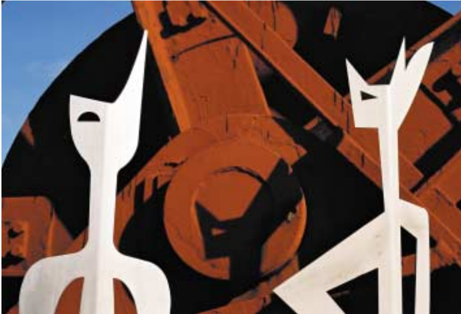
Königin und König, Ausschnitt Edelstahl