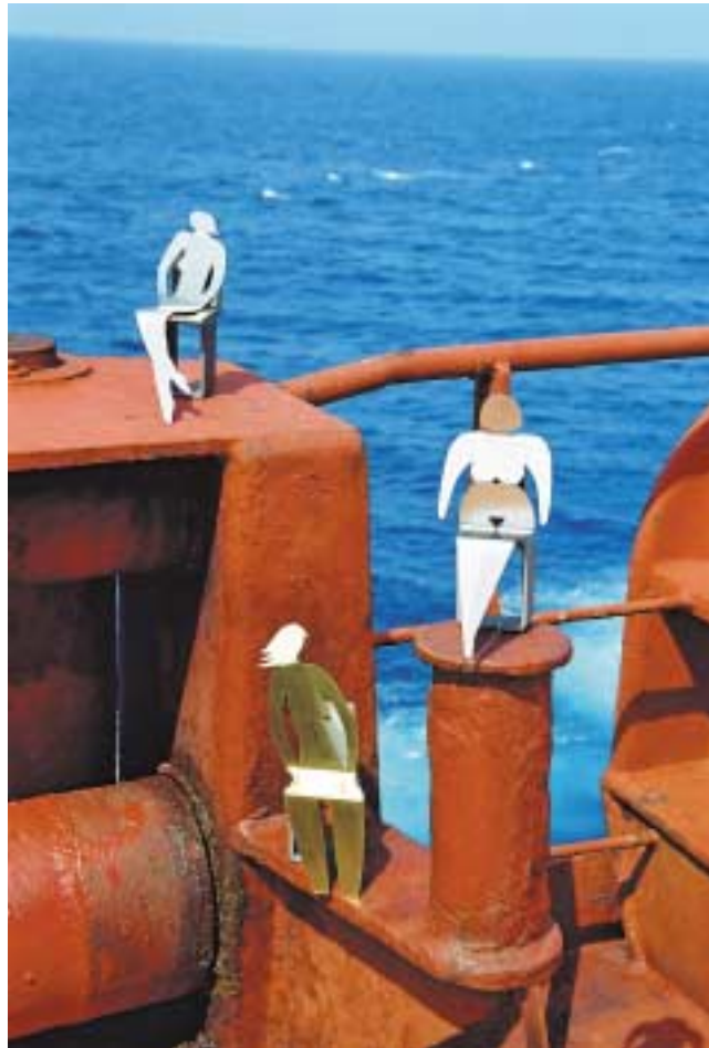
Ohne Titel, 24 cm hoch Edelstahl und Messing