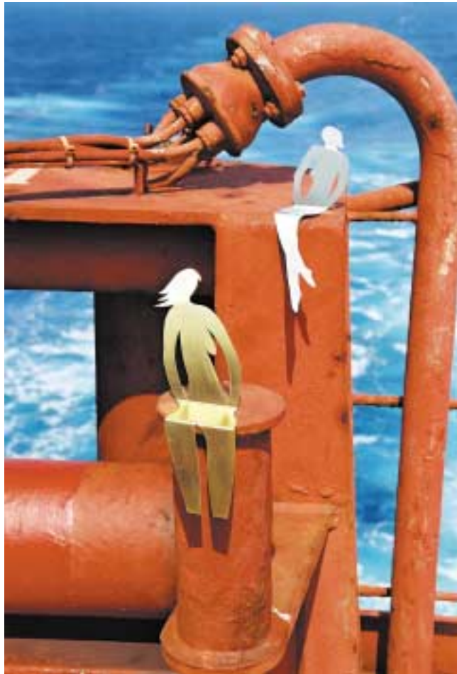
Ohne Titel, 24 cm hoch Messing und Edelstahl