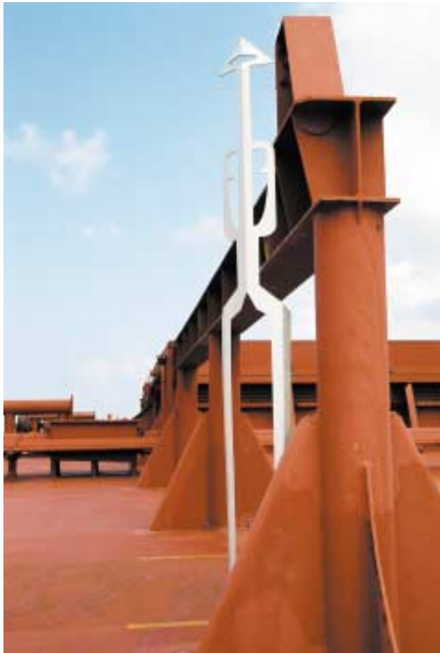
Wächter, 2,50 m hoch Edelstahl