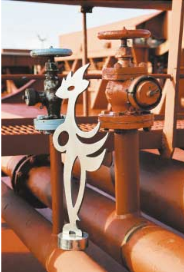
Hahn, 50 cm hoch Edelstahl