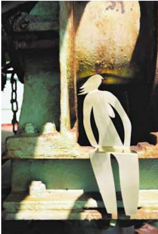
Ohne Titel, 24 cm hoch Messing