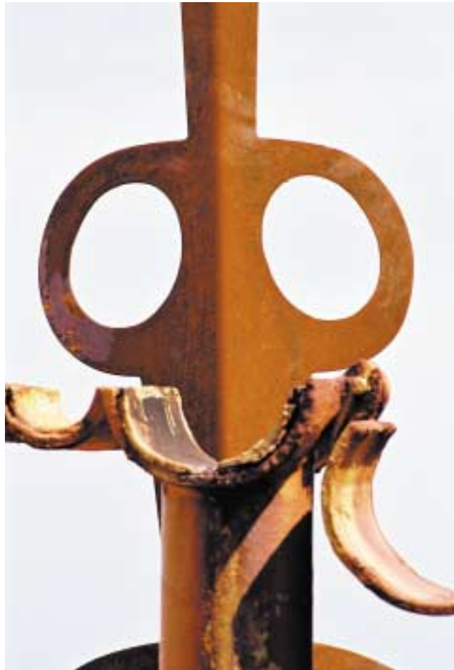
Komposition Corten-Stahl und Schiffsteil