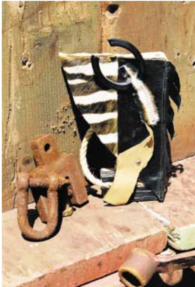
Kleiner Indianer, 25 cm hoch Mixed Media