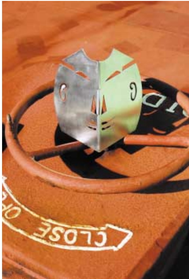
Maske, 18,5 cm hoch Messing