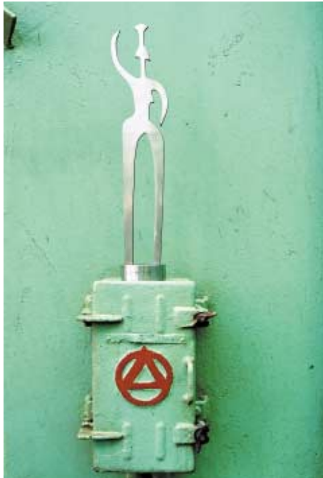
Kleine Tänzerin, 50 cm hoch Edelstahl