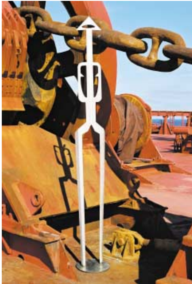
Wächter, 2,50 m hoch Edelstahl