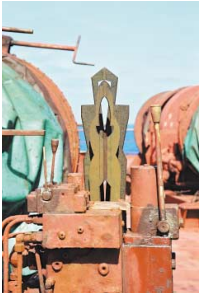
Ägypter, 1,25 m hoch Corten-Stahl