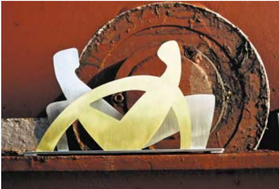
Im Gespräch, 20 cm hoch Messing und Edelstahl