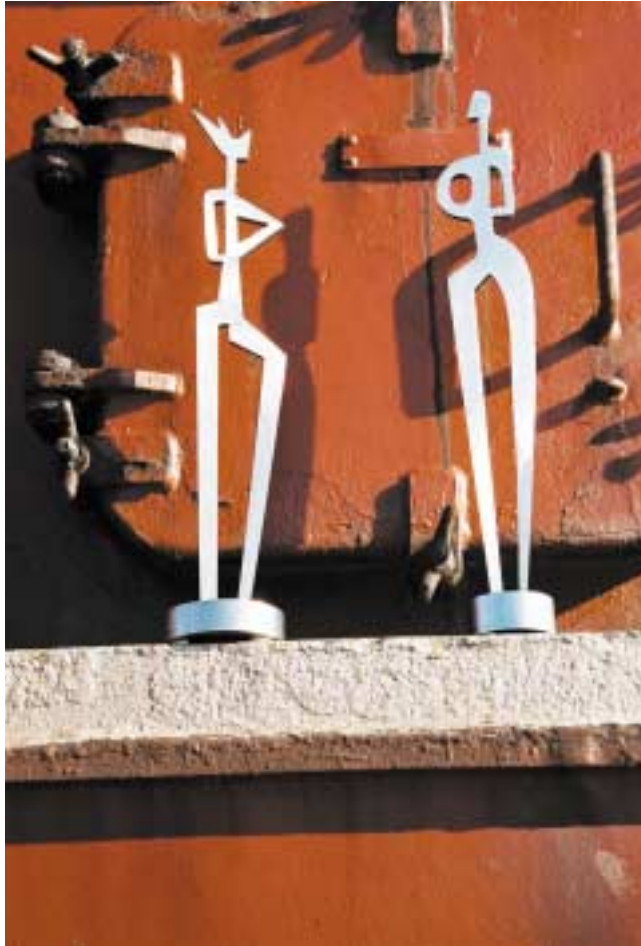
Kleiner König und Wächter, 50 cm hoch Edelstahl