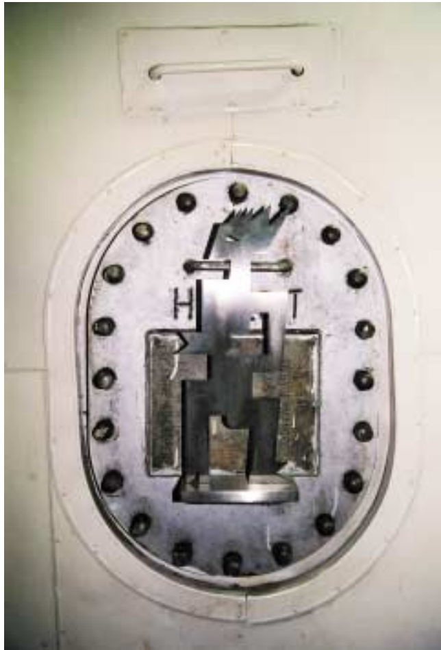
Mexikaner, 50 cm hoch Edelstahl