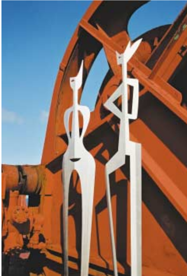
Königin und König, 2,50 m hoch Edelstahl