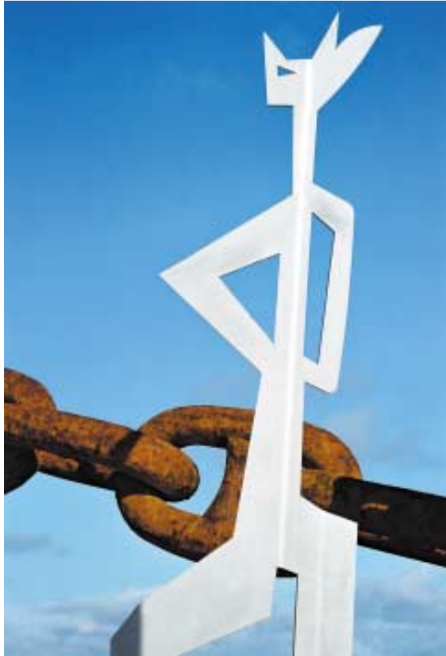
König, Ausschnitt Edelstahl