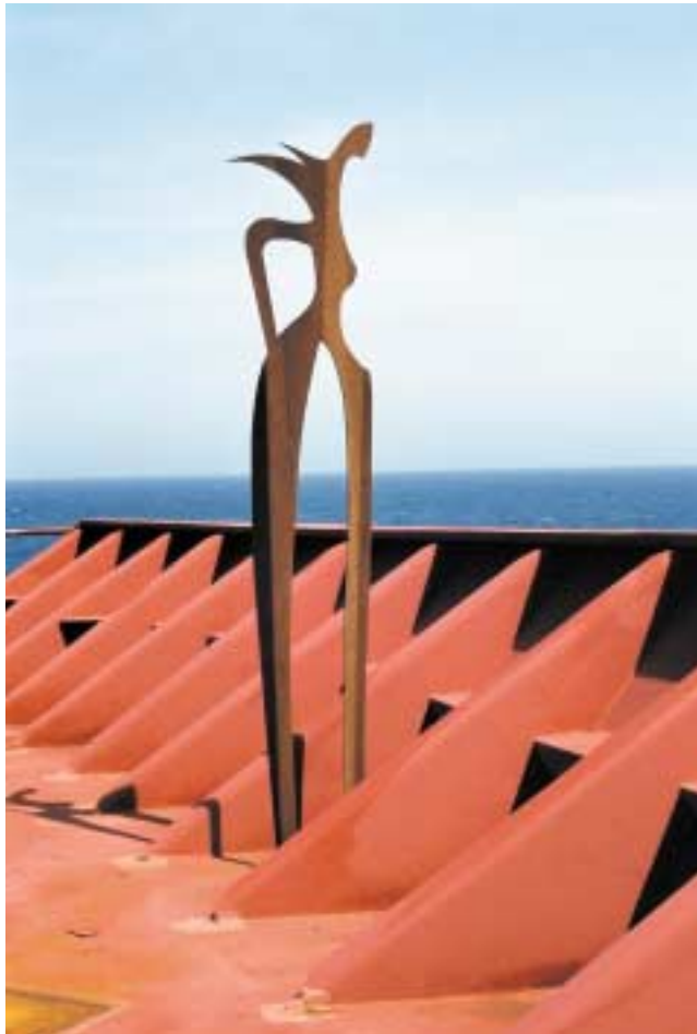
Botin, 2,50 m hoch Corten-Stahl