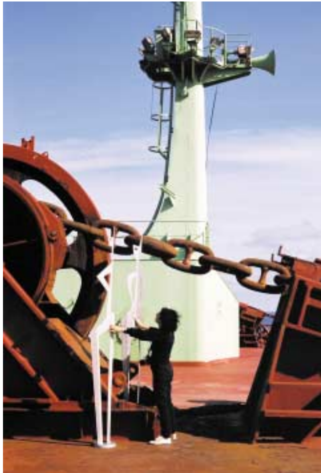
König und Königin, 2,50 m hoch Edelstahl