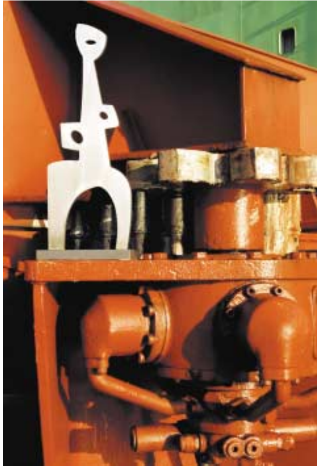
Africana, 50 cm hoch Edelstahl