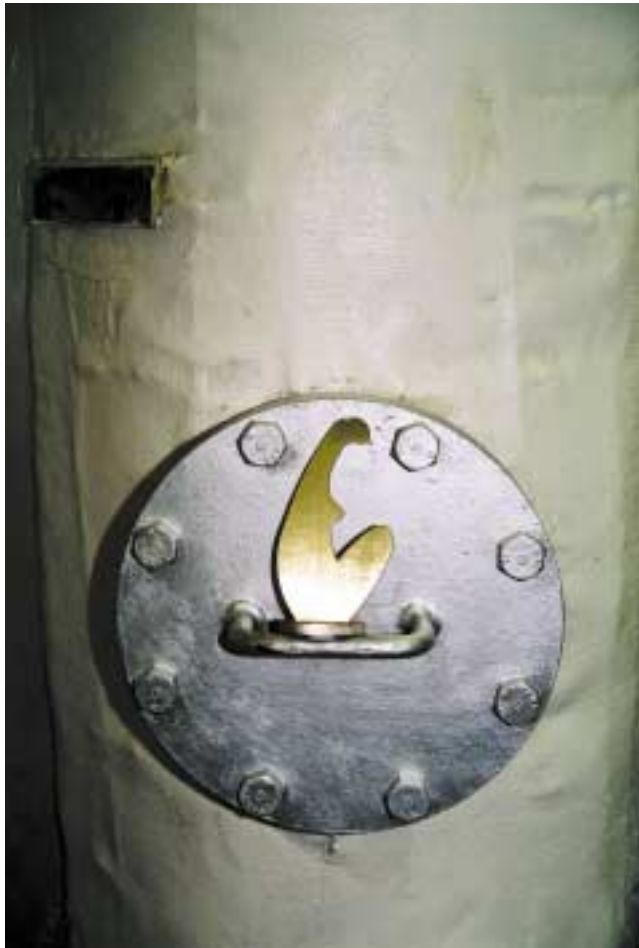
Kleiner Akt, 13 cm hoch Messing