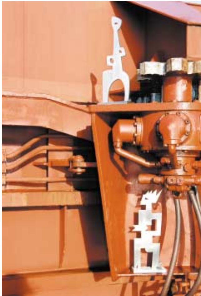
Africana und Mexikaner, 50 cm hoch Edelstahl