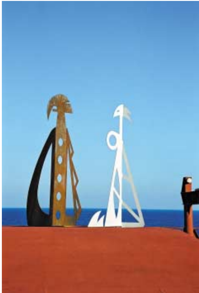
Oxalá und Jemanjá, 1,55 m hoch Corten-Stahl und Edelstahl