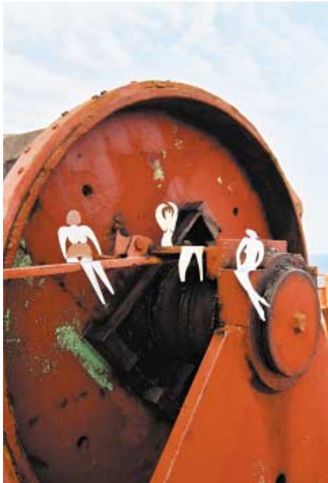
Ohne Titel, 24 cm hoch Edelstahl