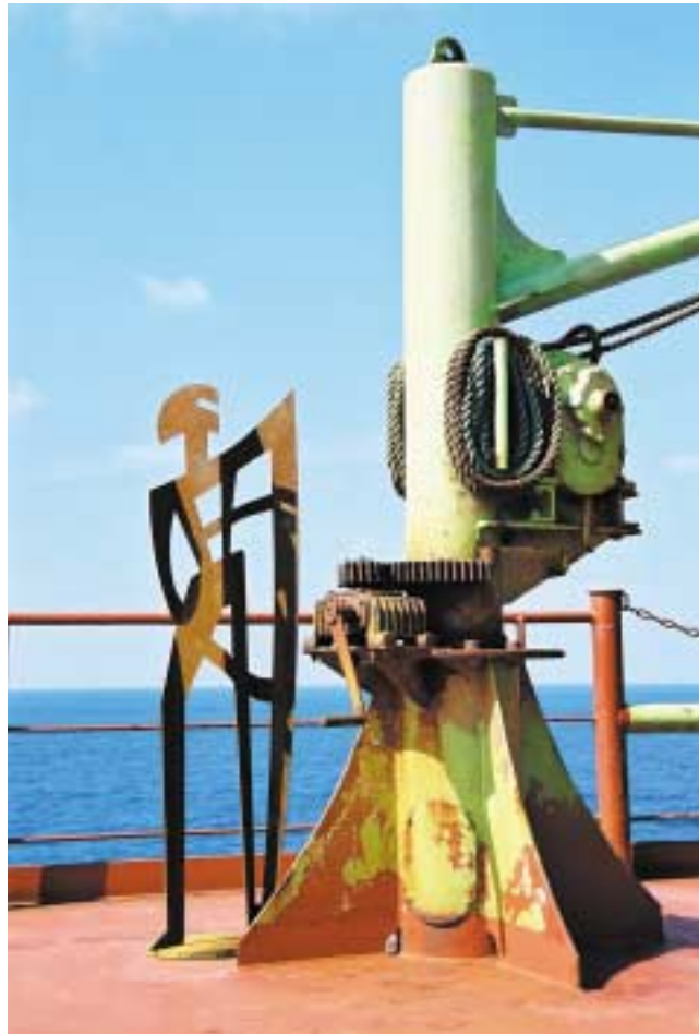
Kleiner Schildträger, 1,60 m hoch Corten-Stahl